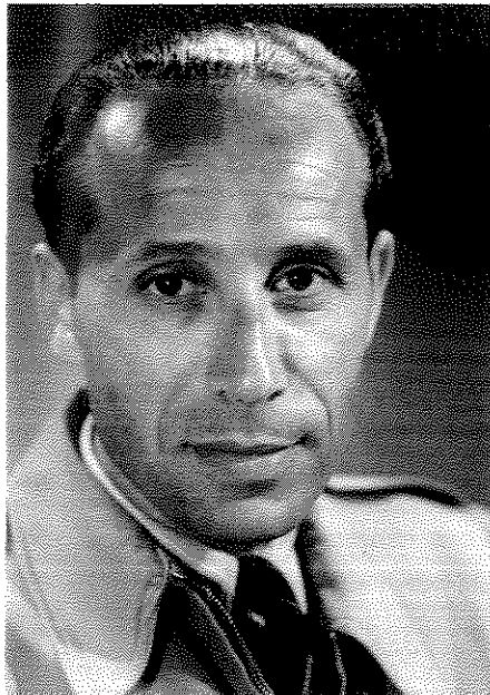
תקרית צילומית בקונצרט הבכורה

יש מי שרואה בהם צילומים "מגויסים" בדומה לצילומים הסובייטיים של אותו זמן, שגויסו לפאר את המשטר הקומוניסטי, אבל אפשר להשוותם גם לצילומי המשבר הכלכלי הקשה שצולמו בימים ההם בארצות הברית, אשר ממשלתה ומוסדותיה גייסו את צלמי ארצם לצלם את התיים של און. גם זה היה "צילום מגויס" שמטרתו לשרת את צורכי החברה.