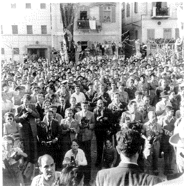
הצלמים שנשארו בחוץ בטקס ההכרזה, צילום של ויסנשטין, הצלם שבא מבפנים