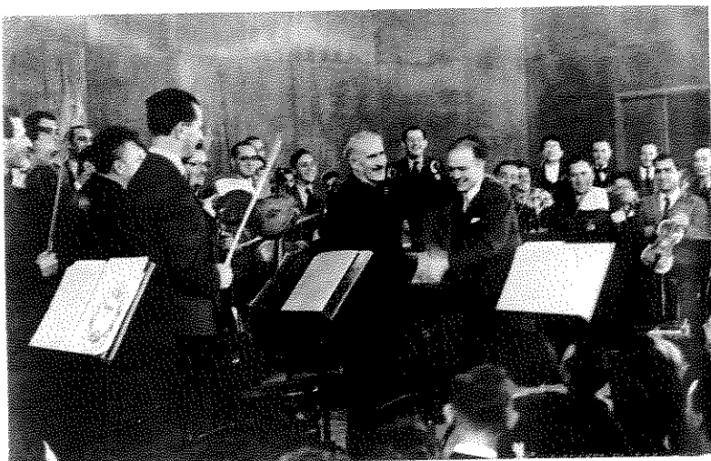
טוסקניני (באמצע) והוברמן בקונצרט הבכורה של התזמורת הפילהרמונית, תל אביב, דצמבר 1936. ויסנשטיין צילם את ההמונה במצלמה קטנה, ללא פלש

ויסנשטיין צילם כל מה שנתבקש לפרנסתו; צילם בשביל ארכיטקטים את בתיהם, אבל עיקר עבודתו ואהבתו היה צילום דיוקנאות. בעצם היתה זו מעין עבודה עתונאית, שכן הוא צילם דיוקנאות של תושבי הארץ ומנהיגיה וסידרה זו, שבה מאות צילומים, היא גם דמותה של הארץ וסיפורתה. הדיוקנאות היו גם תיעוד של תולדות הארץ דרך פני מעצבי דמותה. אתה רואה בתמונות אלה את בן גוריון, יושב ראש הנהלת הסוכנות היהודית המנהל את המאבק לעצמאות ואת ראש הממשלה בן גוריון בימי המדינה, קובע את גורלה. אתה רואה את יצחק רבין כקצין צבא צעיר במלחמת העצמאות,