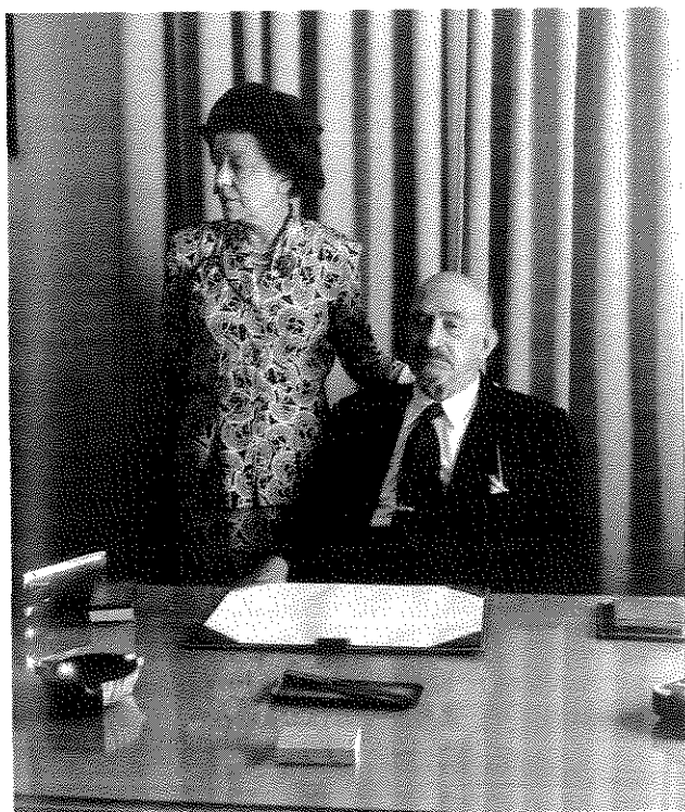
ד"ר חיים וייצמן, נשיא מועצת המדינה הזמנית, עם אשתו ורה, 1948