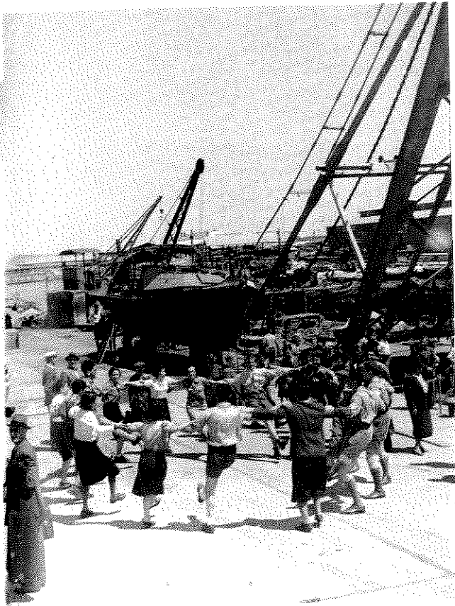
ריקוד הורה ראשון של חניכי עליית הנוער במולדת. נמל חיפה 1939