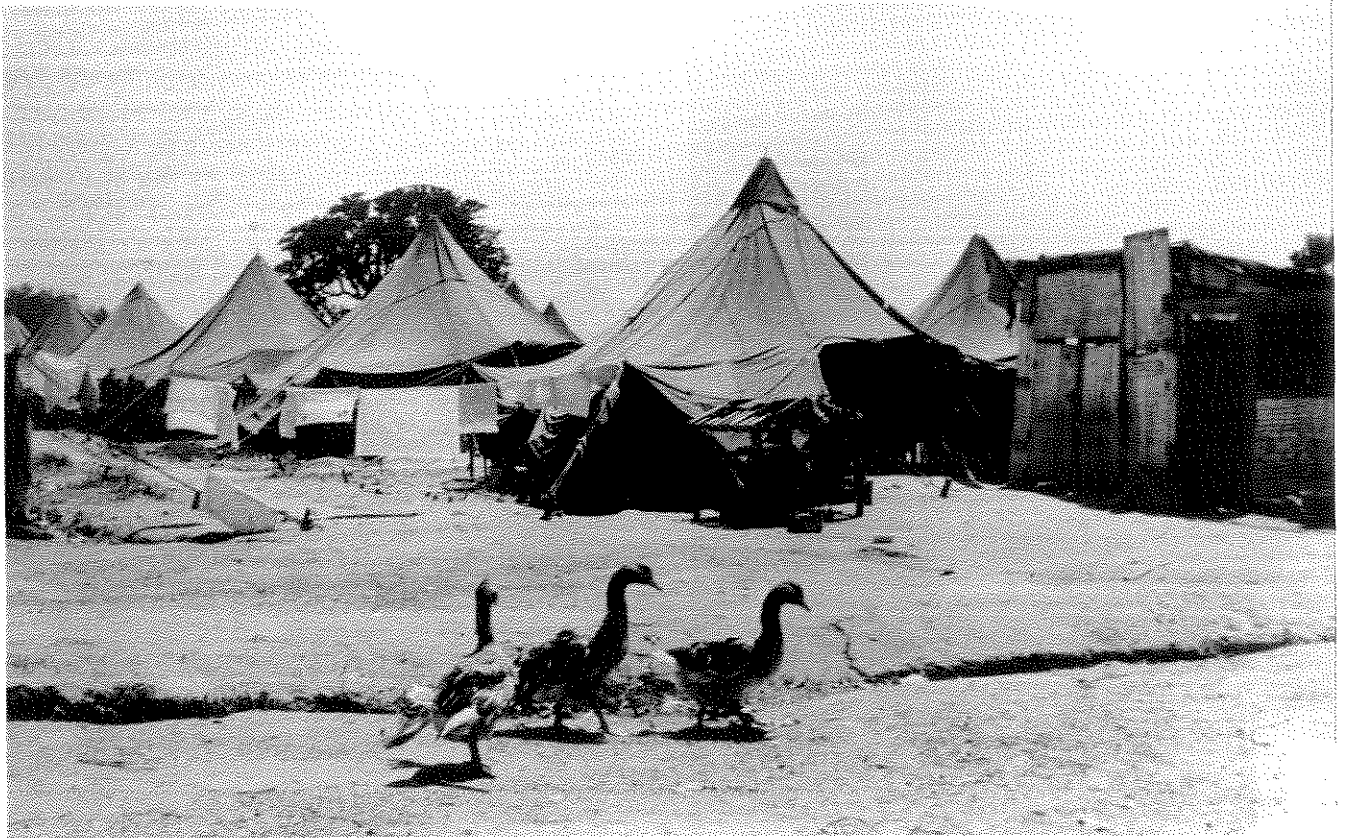
ויסנשטיין הרבה לצלם ברחבי הארץ בשנות המדינה הראשונות. כך הגיע אל המעברות ויישובי העולים וצילם שם תמונות אופטימיות יותר ואופטימיות פחות